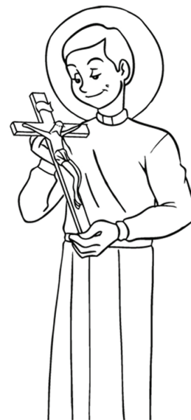
Cantinho São Geraldo

Que tal, a partir desse Natal, nós também começarmos a fazer obras de caridade, ajudando uns aos outros?